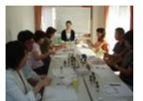
アロマセミナー時の様子↑

これまでのセミナーのレポートが弊社ホームページからご覧いただけます ⇒ http://www.life-c-s.com/